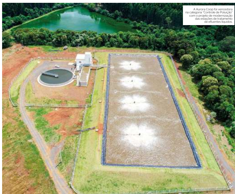
A Aurora Coop foi vencedora na categoria "Controle de Poluição" com o projeto de modernização das estações de tratamento de efluentes líquidos.

A Aurora Coop investiu mais de 40 milhões de reais na implantação e modernização das estações de tratamento de efluentes de três das suas maiores plantas industriais de aves e suínos de Santa Catarina e do Rio Grande do Sul. A instalação dessas estações marcou a história da Cooperativa com avanço tecnológico e adoção de novos conceitos que devem ser replicados em futuras instalações. Parâmetros de lançamento mais restritivos do que os previstos em lei, uso de tecnologia importada, automação, redução de gases de efeito estufa e reuso do efluente na própria estação reforçam, nestes projetos, importantes valores da Aurora Coop como ética, qualidade, confiança e sustentabilidade.